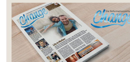
Kann nach wie vor bestellt und verteilt werden: Die Reformationszeitung «Change».

Sind Sie interessiert, «Change» zu erhalten? Gerne können Sie die Zeitung über die unten aufgeführte Webseite bestellen und in Ihrem Umfeld auflegen oder verteilen. Oder sie übernehmen eine sogenannte «Dorfpatschaft» und beschenken eine ganze Stadt, einen Stadtteil oder ein Dorf mit der «Change». Vielen Dank! www.change-zeitung.ch